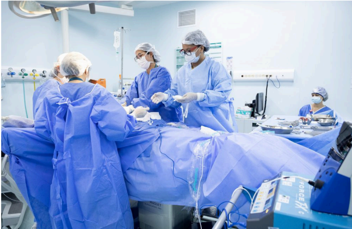
Projeto terá impacto na rede estadual, incluindo aumento de até 20% nos atendimentos

Estruturado em cinco eixos estratégicos, o ARAS SP prioriza regiões com maior demanda assistencial e dependência de serviços