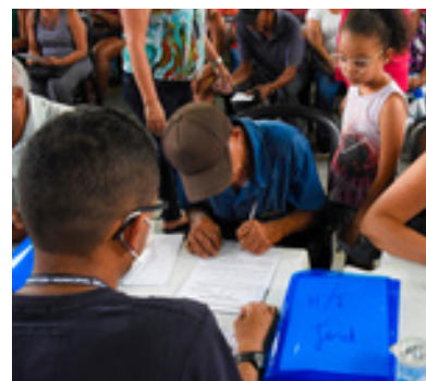
Mais R$ 150 no Família Cajamar

Na área de Infraestrutura e Meio Ambiente, Cajamar avançou com iluminação pública 100% em LED no bairro Vila Nova Paraná, início do programa Ilumina Cajamar, instalação de novos abrigos de ônibus e a entrega do Ecoporto Cajamar. Já na Habitação, 450 famílias receberam seus títulos de propriedade, garantindo segurança jurídica e mais dignidade.