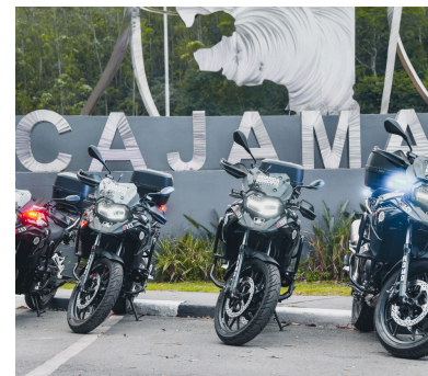
8 motos BMW para GCM