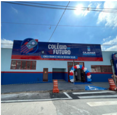
Novo Colégio do Futuro de Jordanésia