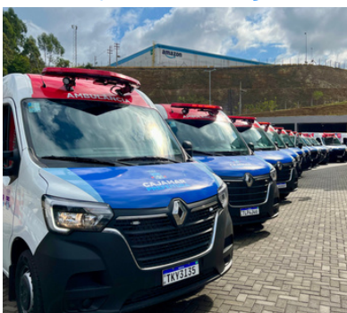
11 novas ambulâncias