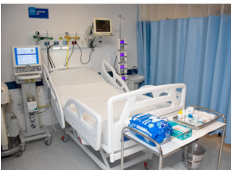
10 leitos de UTI no Hospital Municipal