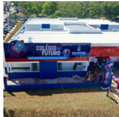
Novo Colégio do Futuro do Polvilho