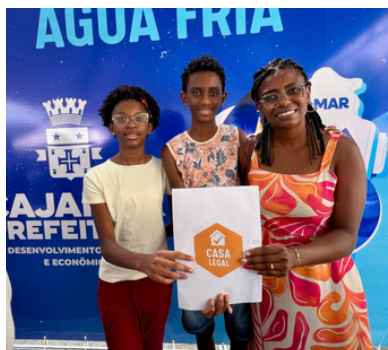
450 títulos de propriedade