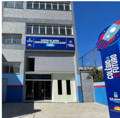
Centro Especializado Jordanésia