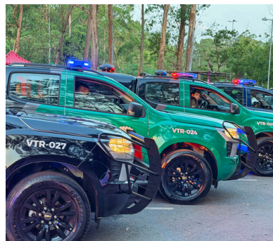
21 novas viaturas para GCM