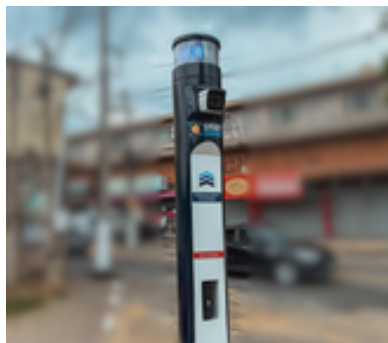
Implantação do SmartCajamar