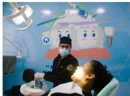
Dentista 24h na UPA