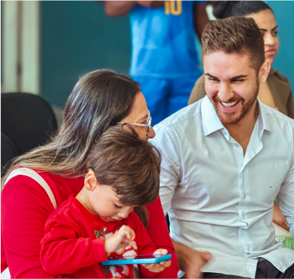
Gestão do prefeito Kauan Berto também é aprovada por 84,8% da população

Em outro dado importante, o Instituto AR7 Pesquisas Inteligentes perguntou aos moradores de Cajamar se eles aprovam ou desaprovam a maneira como o prefeito Kauan Berto está governando a cidade, e os resultados mostram que 84,8% da população aprova, 11,9% desaprova e 3,3% não quis opinar. A pesquisa ouviu 604 moradores de todas as